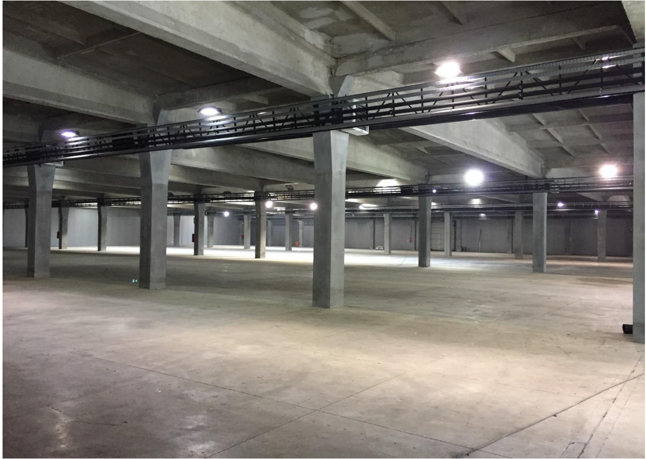
Parcare interioara imobil